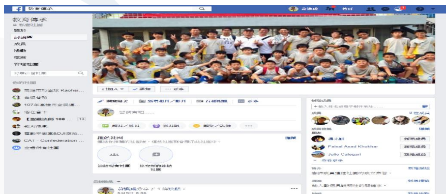
教育傳承—提攜後進